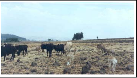
ምስል 1. የአርሻ መሬቶች ያለማቋረጥ ማዕድናቸው ስለሚሟጠጥ ምርታማነታቸው በፍጥነት ያሸቆላቀላል (ሰሜን ሸዋ አካባቢ)።

እንዲያውም ሥር እየሰደደ የመጣው የምርታማነት ማሸቆልቆል፤ ለድርቅ ተጋላጭነት፤ የቤተሰብ ምጣኔ ሀብት መዳሸቅ፤ ወዘተ... ተጨባጭ አመላካቾች ናቸው።