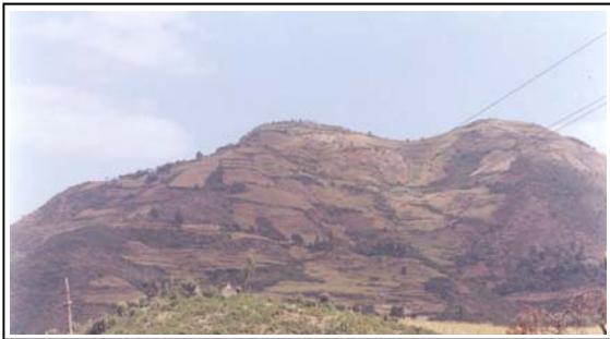
ምስል 3. ከፍተኛ ተዳፋትነት ያላቸው መሬቶች ያለምንም የአፈር መጠበቂያ ዘዴ ለአርሻ በመዋላቸው ለከፍተኛ የአፈር መሬቶች እየተዳረጉ ነው (ወሎ፣ ባቲ አካባቢ)።

በጥናቱ የተካተቱት ገበሬዎችና ባለሙያዎች የተበላሰጠ የመሬት ግብር ክፍያ ሥርዓትን በመሰረቱ ተቀብለውታል ለማለት ያስደፍራል።