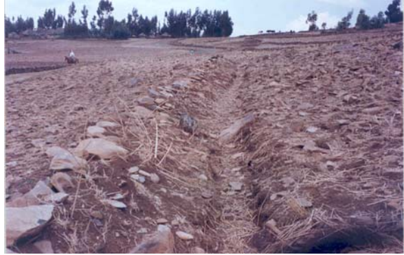
ምስል 1. የጤፍ እርሻ መሬቶች ለከፍተኛ የአፈር መሬቶች የተጋለጡ ናቸው (ሰሜን ሸዋ፣ ፍቼ አካባቢ)።

በጥቅሉ የብርዕና አገዳ ሰብሎች ለከፍተኛ የአፈር መሬቶች በምክንያትነት ተጠቃሽ ናቸው። ነገር ግን በእነዚህ ሰብሎች መሃል የአስተራረስና የአያያዝ ሁኔታቸው ስለሚለያዩ የአፈር መከላከል መጠንም እንዲሁ ከፍና ዝቅ ይላል። ጤፍ ከሌሎች የምግብ ሰብሎች አንጻር ሲታይ የማሳ ዝግጅቱ ተደጋጋሚ የመሬት ማለስለስን (እስከ አምስት ጊዜ) መፈለጉ ጉልበትን በእጅጉ መፍጀቱ ብቻ ሳይሆን አፈሩ በቀላሉ በውሃና ንፋስ ተጠርጎ እንዲወሰድ ያደርገዋል። ሌላው የጤፍ መሬትን ለከፍተኛ የአፈር መሬቶች የሚዳርገው ምክንያት የጤፍ ሥር ጥልቀቱ በጣም አጭር በመሆኑ አፈሩ ታጥቦ አልቆ መጠኑ ከ30 ሴ.ሜ በታች እስኪደርስ ድረስ እንኳ አደጋውን መገንዘብ ለበርካታ ገበሬዎች ቀላል አለመሆኑ ነው።